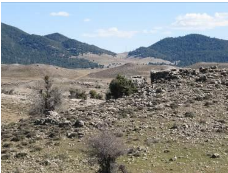
Karstlandschap bij Ifrane