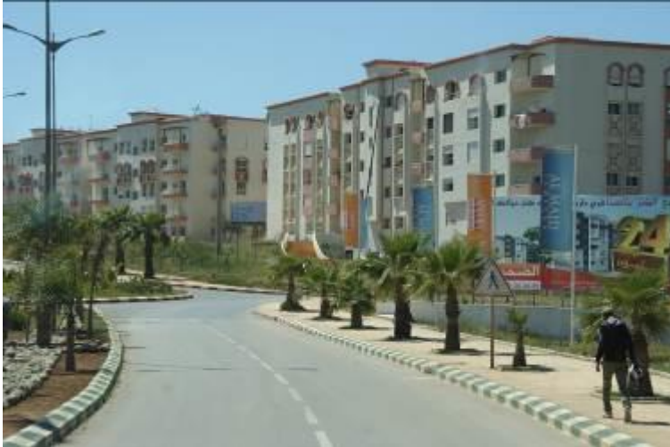
Entree van de satellietstad Tamesna