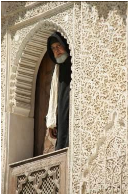
Medersa in Fez