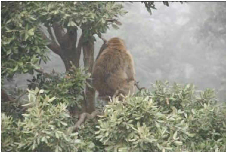
Aap in een steeneik bij Azrou